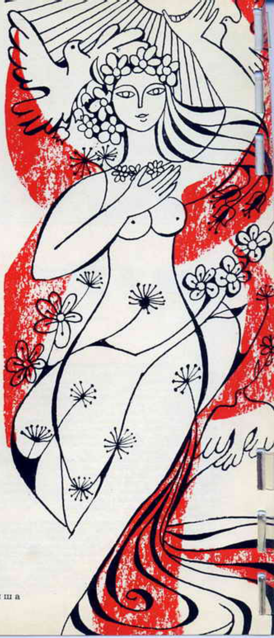
Рисунок А. Тертыша