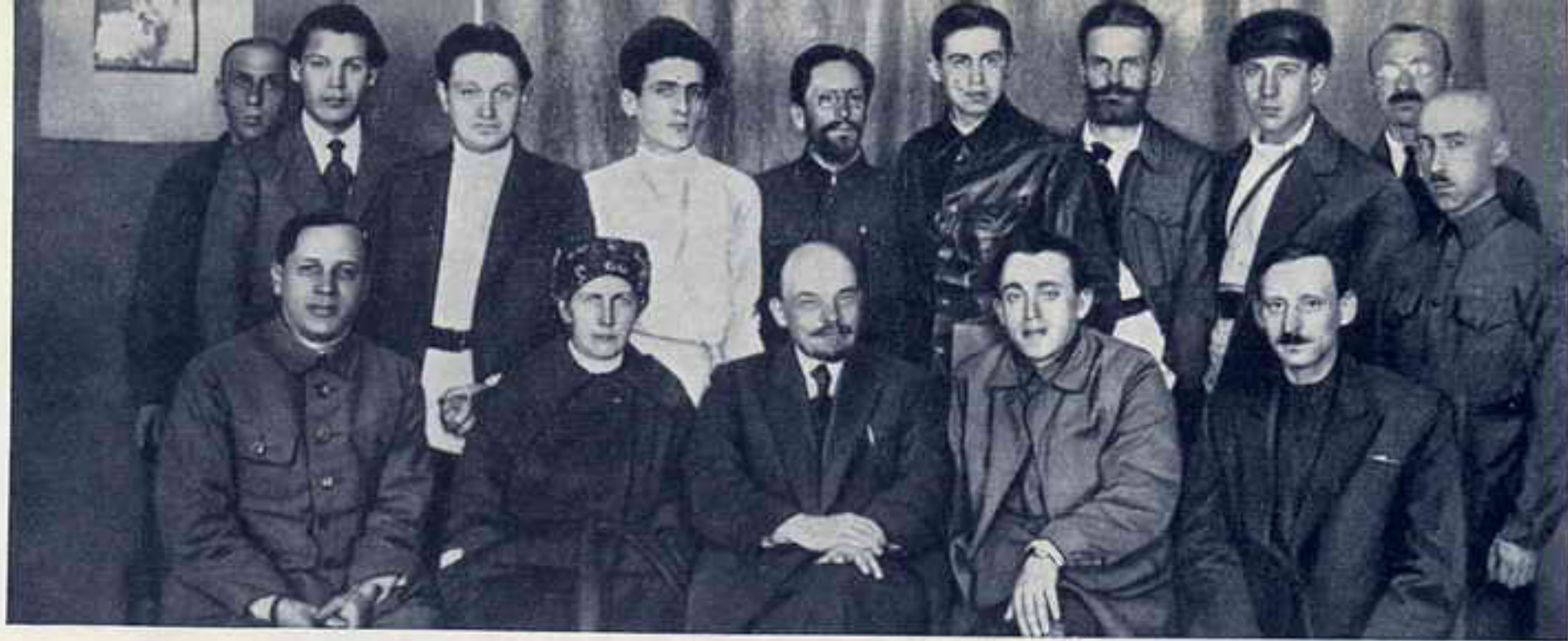
В. И. Ленин с группой сотрудников «Центропечати», работавших над записью его речей на пластинки.